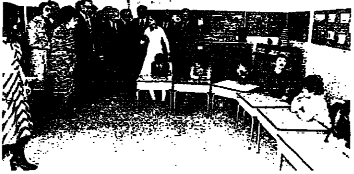
غرفة الصغار المتخلفين